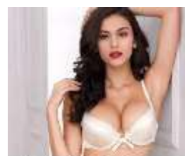
Push Up Bra